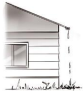
SUELO 1 LÍNEAS DE GOTEO