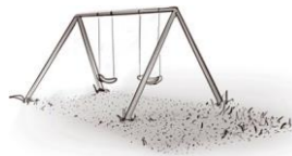
SUELO 2 ÁREA DE JUEGO JARDÍN