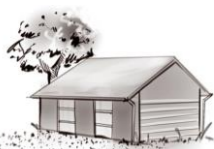
SUELO 3 BORDE DE LA CARRETERA/ ACERA