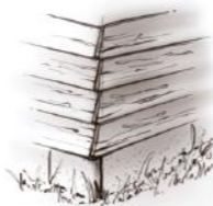
PINTURA 2 PINTURA EXTERIOR