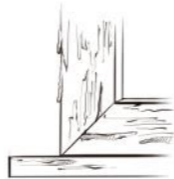
PINTURA 1 PINTURA INTERIOR